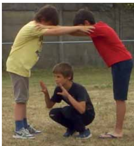
Les patelles attendent la marée