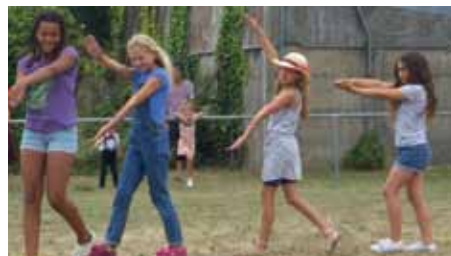
Les huîtres s'ouvrent et se ferment