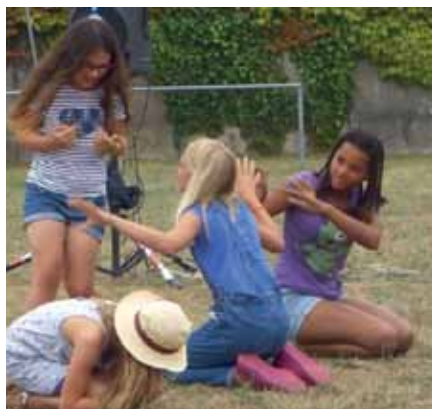
L'étoile de mer

Les élèves de CM étudient les espèces présentes sur l'éstran des Proires, depuis deux ans. Ils ont présenté leurs découvertes sous forme de mimes. Saurez-vous reconnaître les animaux ?