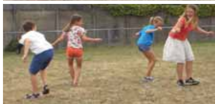
La moule est cachée dans sa coquille