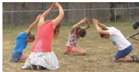
Les crabes se cachent sous les rochers