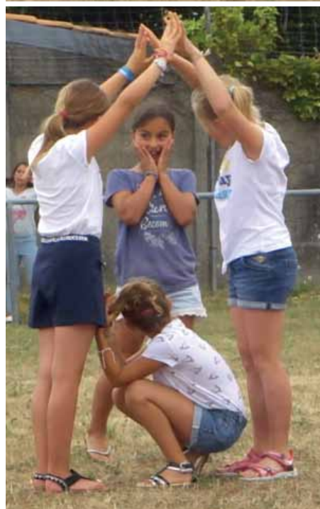
Les anémones lâchent de l'encre pour se dissimuler