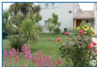
4. Monsieur COCHU 105 rue de Saint Denis