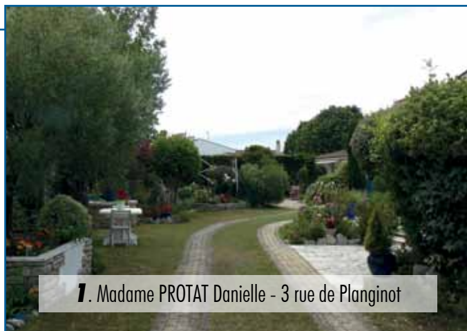
1. Madame PROTAT Danielle - 3 rue de Planginot

Pour le 32 ème concours, la commission communale a décerné les prix selon l'ordre suivant :